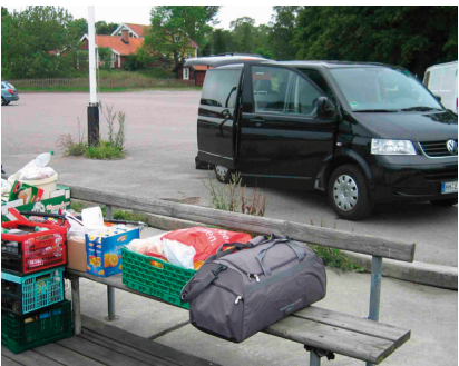
◄ Crewwechsel mit unkomplizierter An- und Abreise