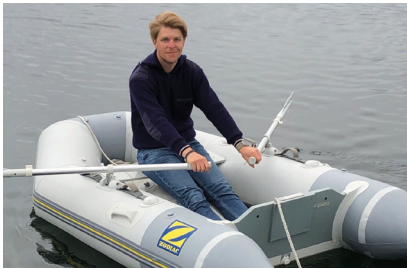
Das Schlauch- boot gehört zur Ausrüstung ►